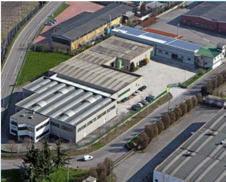
De Q-Fits fabriek in Italië

Onze kwaliteits kranen, afsluiters en toebehoren worden geproduceerd bij de fabriek in Italië. De fabriek beschikt over de nieuwste productietechnieken. Hierdoor zijn wij in staat u de hoogste kwaliteit te leveren en wat zeker belangrijk is voor uw " zeer scherpe prijzen ". Voor het juiste prijsvergelijk kunt onze kranen, afsluiters en toebehoren vergelijken op de site van 2ba ( http://www.2ba.nl ). Op deze site kunt ook zien via welke groothandels in Nederland de fittingen te bestellen zijn. De installateurs kunnen de fittingen van Q-Fits uitsluitend via de groothandels bestellen.