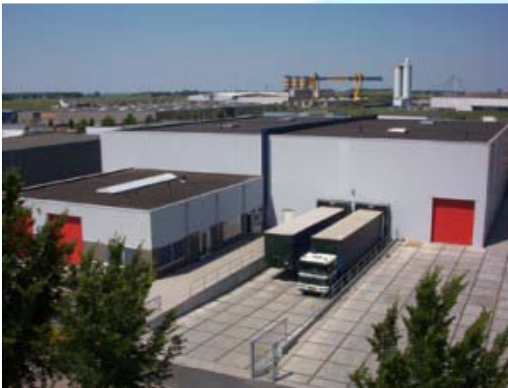
Q-Fits Logistiek Centrum in Nederland

Q-Fits heeft ook aan het gebruiksgemak voor onze klanten gedacht. Alle fittingen zijn per 10 stuks verpakt en dus ook per 10 stuks te bestellen. De fittingen worden geleverd van uit ons logistiek centrum in Kampen.